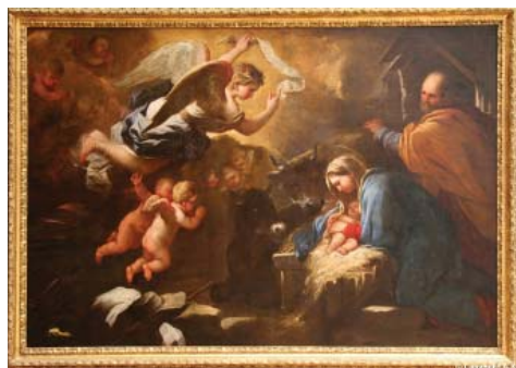
Nașterea lui Isus, ulei pe pânză, Luca Giordano (1634 – 1705)

Se spune că în fragedă tinerețe, Luca Giordano a fost ucenicul pictorului spaniol José de Ribera care lucra pentru viceregele de Napoli, orașul de naștere