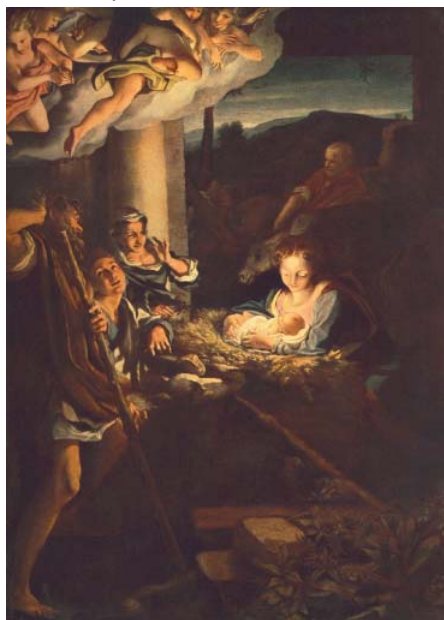
Adorația păstorilor, tablou de altar, ulei pe lemn, Correggio, 1528-1530

Domnului din bazilica San Prospero din orașul Reggio Emilia. Finalizarea picturii a fost făcută la terminarea lucrărilor, când a fost inaugurată capela, deoarece pictura era tablou de altar de dimensiuni mari (256 x 188cm). Aici lumina iradiază de la Pruncul Isus, punând în valoare personajele, norii și vârtejul de îngeri. Femeia din grupul celor veniți să-L vadă pe noul născut, anunțat de îngeri, este surprinsă de lumina iradiată de Prunc și se ferește cu mâna stângă ridicată. Este încântată, curioasă și privește cu drag Fecioara care-l ține-n brațe pe Isus cu o mare gingășie și dragoste. Și fețele celor doi păstori aflați în dialog exprimă încântare și mirare.