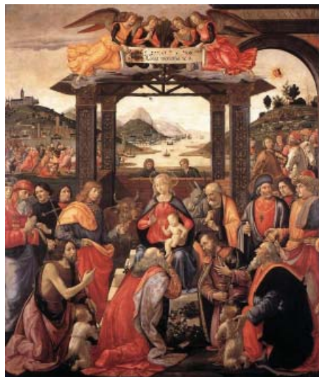
Adorația Regilor-Magi, tempera pe lemn, Domenico Ghirlandaio, 1488

După spusele lui Vasari, Domenico Bigordi , zis Domenico Ghirlandaio își datorează supranumele meseriei tatălui său, un meșter aurar