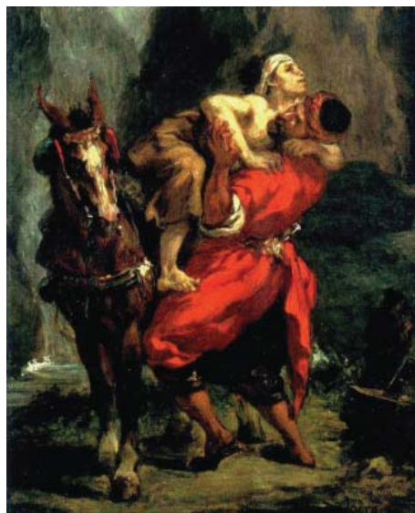
Eugene Delacroix, Bunul Samaritean, 1849

Construcția tabloului și momentul acțiunii l-au impresionat mult pe Van Gogh, care puțin înainte de moarte a dat propria interpretare a acestui moment, bineînțeles în propriul stil coloristic și pictural.