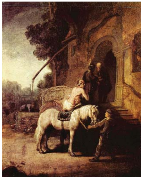
Rembrandt Harmenszoon van Rijn, Bunul Samaritean, 1632-1633, Wallace collection, Londra

Samariteanul l-a pus pe “dobitocul său”), iar el discută cu hangiul și putem deduce că plătește cei ”doi dinari” pentru îngrijirea rănitului și promite (cum spune textul Evangheliei) că va reveni și va încheia socotelile.