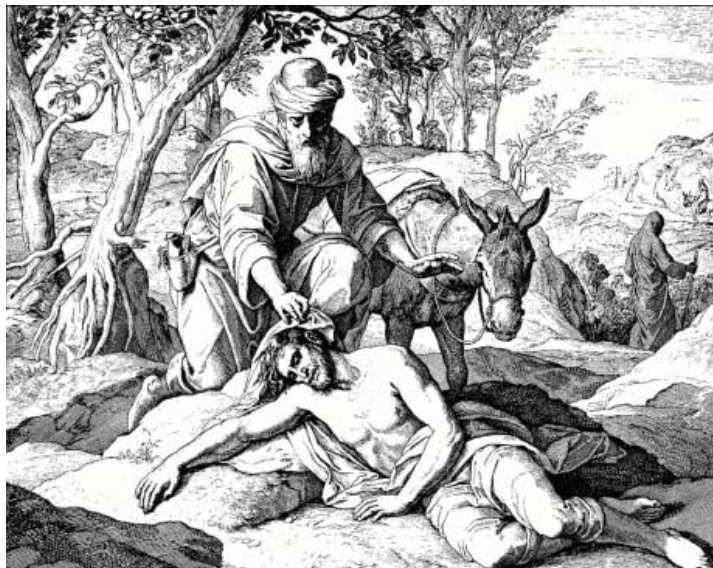
Julius Schnorr, Bunul Samaritan, sau Samaritanul milostiv

Tema parabolei i-a preocupat mult pe artiști, motiv pentru care operele de artă legate de Bunul Samaritan sunt numeroase. Doresc să încep ilustrarea comentariului parabolei cu o gravură a lui Julius Schnorr extrasă dintr-o Biblie în imagini apărută între anii 1851 și 1860.